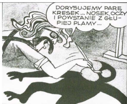
Rys. 8. Kadr z Księgi I o powstaniu Tytusa

– jednym z kluczowych nawiązań – i to bezpośrednich – jest pierwsza scena w późniejszych wydaniach Księgi I , odnosząca się do początkowej sceny w Księdze I z komiksu Witek Sprytek i Asa , a dokładniej do jednej z wersji dotyczącej pojawienia się Tytusa. Widzimy na nich dwóch rysowników; w pierwszym przypadku jest to Dziadzio Chmiel, zaś w drugim Papcio Chmiel (patrz: rys. 5 i 6). Poza tym widnieje na nich podobny sposób posługiwania się narzędziami do rysowania oraz obecny jest – po raz pierwszy w Witku Sprytku i Asie – autotematyzm, gdyż rysownicy są jednocześnie autorami komiksu. I przede wszystkim, Witek i Tytus powstają z tuszu (rys. 7 i 8);