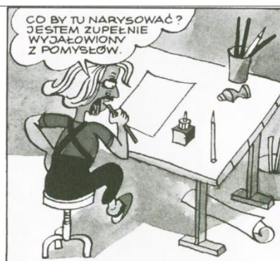
Rys. 6. Kadr z Księgi I o pracy Papcia Chmiela