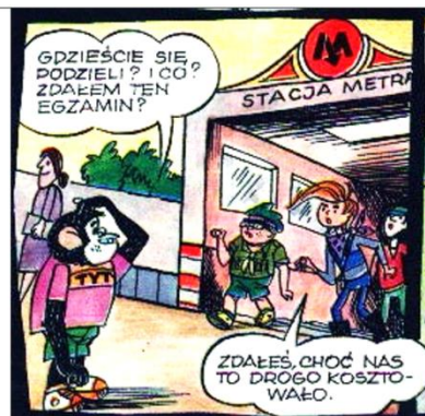
Rys. 4. Kadr z Księgi I z wydania V

Oprócz pomijania w opracowaniach komiksologicznych „przedtytusowej” twórczości Chmielewskiego, nie podejmuje się w nich także analizy związków i nawiązań książkowej serii z przygodami Tytusa wydawanymi w „Świecie Młodych”. A jest ona, naszym zdaniem, kluczowa do zrozumienia nie tylko treści „TRiA”, lecz także sposobów jej kreowania, budowania scenariuszy, jak i nowatorskich – w polskim komiksie – rozwiązań, np. eksperymentów z kadrem czy burzenie czwartej ściany. Jednakże kreowanie „tytusowego” uniwersum nie rozpoczęło się wraz z pojawieniem się trójki bohaterów, lecz znacznie wcześniej. Należy przez to rozumieć, że Chmielewski korzystał z pomysłów czy scenariuszy z poprzednio tworzonych komiksów. Podobieństwa te możemy odnaleźć bez większego trudu w seriach i krótkich formach komiksowych wydawanych na łamach „Świata Przygód”, „Świata Młodych”, „Czynu Młodzięży” czy „Kuriera Polskiego”. Podzielić je możemy tematycznie i opatrzyć dodatkowymi określeniami, jako bezpośrednie i niebezpośrednie, przy czym niekiedy trudno o wyraźne ich rozróżnienie. W pierwszej kolejności przyjrzyjmy się podobieństwom do Tytusa: