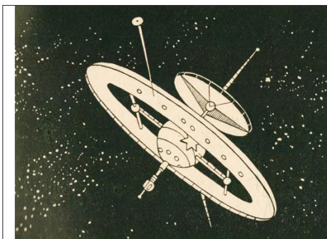
Rys. 1. Ilustracja Henryka J. Chmielewskiego z książki RM-I startuje