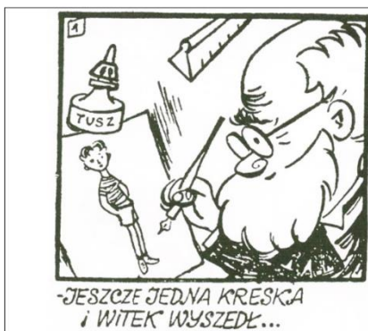
Rys. 5. Kadr z Witka Sprytnka i Asa o pracy Dziadka Chmiela

Oprócz pomijania w opracowaniach komiksologicznych „przedtytusowej” twórczości Chmielewskiego, nie podejmuje się w nich także analizy związków i nawiązań książkowej serii z przygodami Tytusa wydawanymi w „Świecie Młodych”. A jest ona, naszym zdaniem, kluczowa do zrozumienia nie tylko treści „TRiA”, lecz także sposobów jej kreowania, budowania scenariuszy, jak i nowatorskich – w polskim komiksie – rozwiązań, np. eksperymentów z kadrem czy burzenie czwartej ściany. Jednakże kreowanie „tytusowego” uniwersum nie rozpoczęło się wraz z pojawieniem się trójki bohaterów, lecz znacznie wcześniej. Należy przez to rozumieć, że Chmielewski korzystał z pomysłów czy scenariuszy z poprzednio tworzonych komiksów. Podobieństwa te możemy odnaleźć bez większego trudu w seriach i krótkich formach komiksowych wydawanych na łamach „Świata Przygód”, „Świata Młodych”, „Czynu Młodzięży” czy „Kuriera Polskiego”. Podzielić je możemy tematycznie i opatrzyć dodatkowymi określeniami, jako bezpośrednie i niebezpośrednie, przy czym niekiedy trudno o wyraźne ich rozróżnienie. W pierwszej kolejności przyjrzyjmy się podobieństwom do Tytusa: