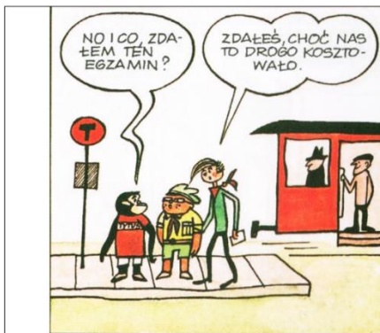
Rys. 3. Kadr z Księgi I z wydania I