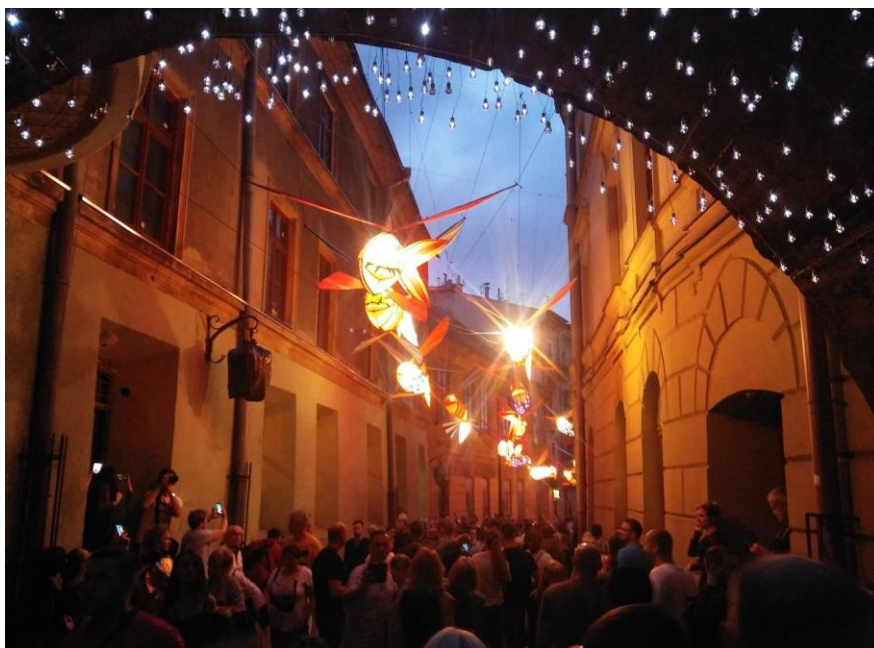
Fot. 1. Noc Kultury na zdjęciu jednej z osób uczestniczących w badaniach w 2018 roku.