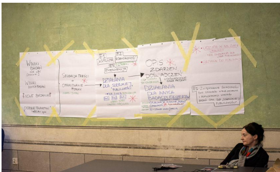
Fot. 2. Próby uchwycenia logiki projektu – pierwsza wizyta studyjna ekspertów i ekspertek.

pozwoliła nam odnaleźć podzielany przez wszystkich punkt wyjścia. Wówczas wyjaśniliśmy wiele wątpliwości, ujawniliśmy milcząco przyjmowane założenia programowe czy organizacyjne, uzgodniliśmy, czym jest sedno atmosfery festiwalu. Nasze wcześniejsze założenie, wedle którego samo przeczytanie książki wytworzy wspólny grunt pomiędzy badaczami z dawnego zespołu oraz ekspertami i ekspertkami zaproszonymi do projektu, okazało się mylne.