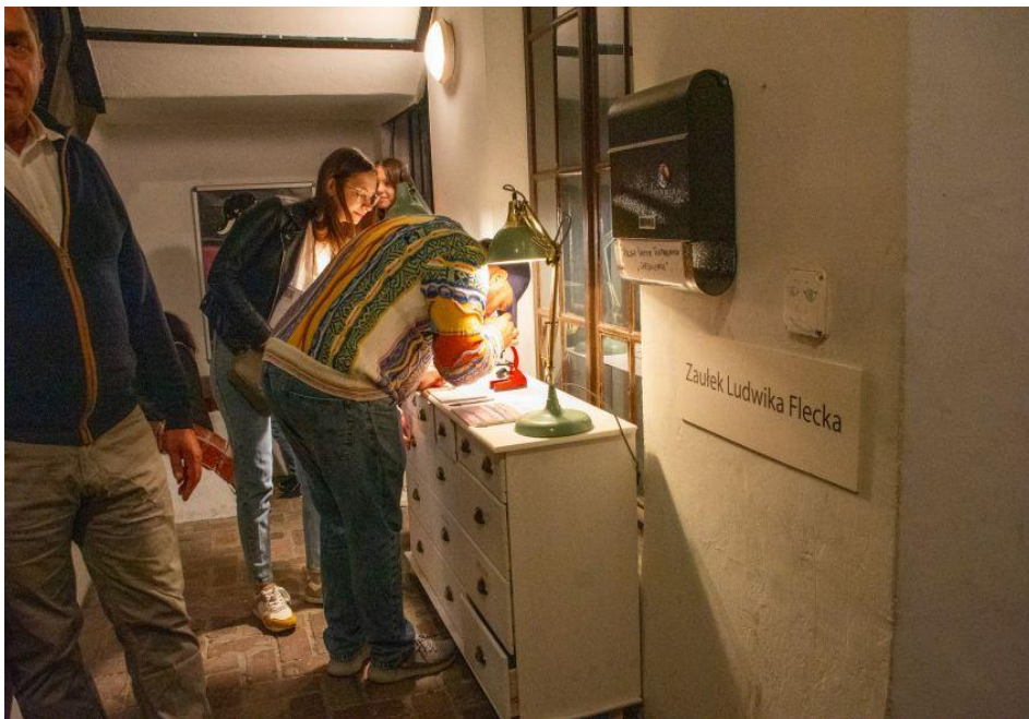
Fot. 7. Komoda Flecka – tak działała.

Trudno szacować skuteczność naszych działań. W przypadku komody Flecka większość wydruków pozostała na miejscu. Wydaje się, że nasze „przedmioty-wabiki” na jej blacie zdominowały resztę, jak na przykład mały, czerwony mikroskop, który miał mieć tylko funkcję estetyczną, ale sprawiał, że ludzie automatycznie spoglądali przez okular – nie znajdując niczego pod spodem. Nasz mikroskop był więc używany dokładnie w takim celu, w jakim go zaprojektowano. Przyciągał uwagę, ale do czego innego niż szuflady i ich zawartość.