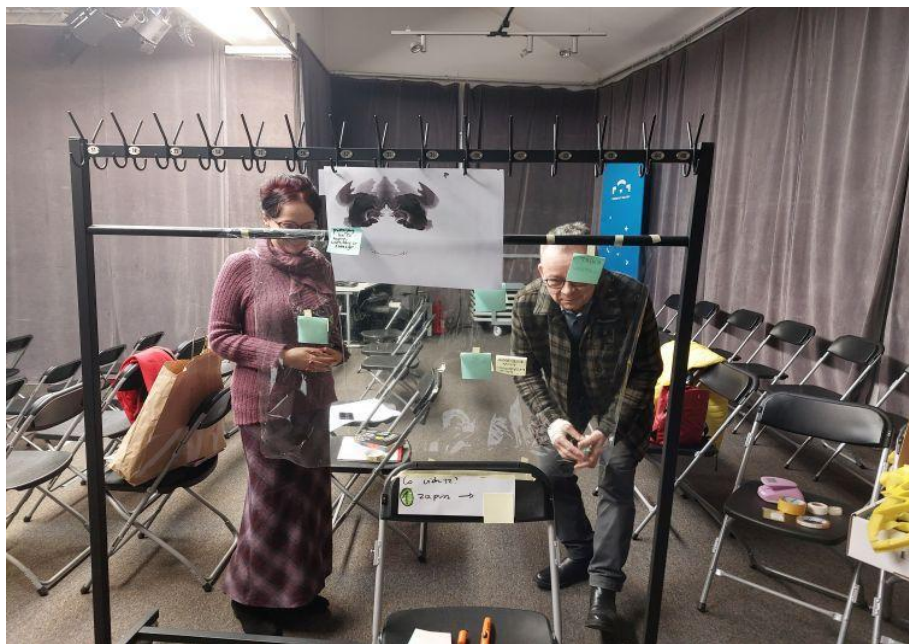
Fot. 4. Prototypowanie jednego z pomysłów na działanie dotyczące postaci Ludwika Flecka.

Postanowiliśmy poddać nasze pomysły wstępnej weryfikacji. Do prezentacji prototypu zaprosiliśmy grupę niezwiązanych z projektem osób. Zaimprovizowaliśmy pięć stanowisk, w których każde wyrażało jakąś ideę, „coś robiło”, choć nie co do każdego mieliśmy pełną jasność „co” i „jak”. Ważne dla nas było to, że stanowiska stanowiły logiczny ciąg, w którym po kolei wchodzi się coraz głębiej, niejako budując na wcześniejszych wrażeniach i odkrywając kolejne elementy układanki, aż po uzyskanie „pełnego obrazu”, czyli zrozumienia głównej idei teoriopoznawczej Flecka. Stanowiska przygotowaliśmy z zamiarem, że będą samoobsługowe i czytelne w przesłaniu. Chodziło o to, żeby jak najlepiej dopasować się do kontekstu Nocy Kultury, co oznaczało unikanie skomplikowanych treści i brak przewodnika tłumaczącego, co gdzie widać i dlaczego. Ważna była też trwałość i wytrzymałość na uszkodzenia w kontakcie z setkami uczestników oraz zdolność przyciągania uwagi i zachęcania do działania.