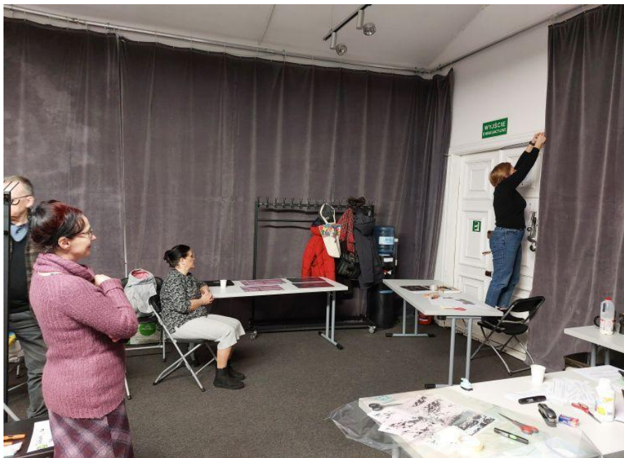
Fot. 5. Prototypowanie jednego z pomysłów na działanie dotyczące postaci Ludwika Flecka.

W trakcie testowania okazało się, że w konfrontacji z uczestnikami nie osiągnęliśmy właściwie żadnego z założonych celów. Do grona testerów należały głównie osoby organizujące NK, wszystkie posiadające wyższe wykształcenie i spore kompetencje kulturowe. Ich odczucia były wspólne. Przeważało poczucie niezrozumienia i chaosu. Wiele osób w ogóle nie podejmowało aktywności, które przewidywaliśmy. Użyte przez nas do opisu cytaty z Flecka były długie i niezrozumiałe, wywoływały irytację, że właściwie nie wiadomo, o co chodzi, o czym to jest, co to miało oznaczać, co tu miało być do zrobienia. Reakcje testerów były dla nas otrzeźwiająjącym doświadczeniem, w efekcie którego wróciliśmy do punktu wyjścia. Wyciągnęliśmy z tej próby wnioski, które istotnie zmodyfikowały nasze postępowanie w projekcie.