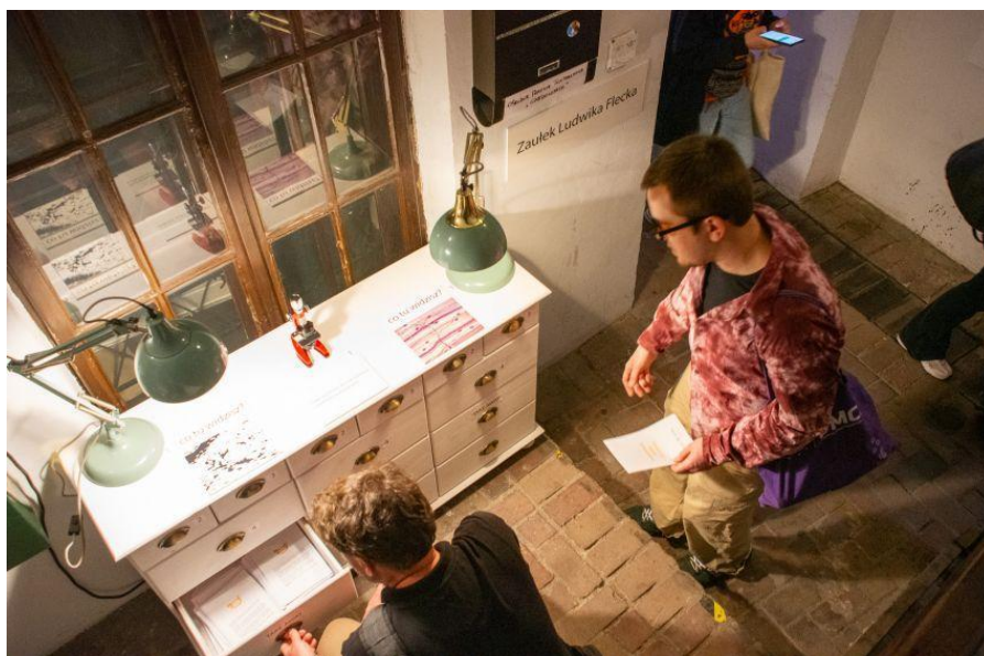
Fot. 6. Komoda Flecka – tak miała działać.

W komodzie umieściliśmy też wydruki przeznaczone do zabrania ze sobą. Zaproponowaliśmy tam tekst z przygotowanego wcześniej briefu, a nawet dodaliśmy krótkie, celne cytaty z prac Flecka. Założyliśmy, że będą cieszyły się popularnością, ponieważ mogą być tworywem dla pamięci, wspomnień, powtórnego sięgnięcia do tych treści. Sporo uwagi poświęciliśmy znalezieniu dogodnego miejsca prezentacji komody. Chodziło o niszę, do której ludzie będą zaglądać bez pośpiechu. Znaleźliśmy takie miejsce obok wystawy malarskiej. Uważaliśmy, że trafi tam publiczność nastawiona na spokojne eksplorowanie bardziej złożonych treści.