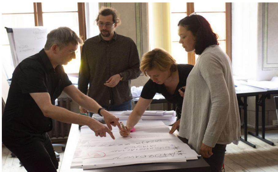
Fot. 3. Wspólne prace nad wstępnymi pomysłami na działania popularyzacyjne – pierwsza wizyta studyjna ekspertów.

Największym wyzwaniem w czasie pierwszej wizyty studyjnej okazało się więc przekucie starych i nowych doświadczeń w konkretne plany do realizacji w przyszłości. Ważnym założeniem naszych poszukiwań, które z pewnością utrudniło nam zadanie, było silne przekonanie, że nie będziemy importować „gotowców”. Wśród krążących pomysłów pojawiały się takie, które były do wzięcia od razu – znane, sprawdzone, wymagające jedynie niewielkich adaptacji i poprawek. Kiedy jednak wchodziliśmy w szczegóły, za każdym razem okazywało się, że nie są one jednak odpowiednie dla tak specyficznego wydarzenia jak Noc Kultury. Byliśmy też świadomi odmienności wiedzy społecznej od przyrodniczej i braku atrakcyjnych artefaktów, które mogłyby zapewnić wrażenia i angażować estetycznie, emocjonalnie i poznawczo. Bardzo trudne okazało się prezentowanie wiedzy naukowej w sposób prosty, ale nie nadmiernie uproszczony, atrakcyjny, ale bez fałszywych skojarzeń, angażujący emocjonalnie i interaktywny, i równocześnie nieprzysłaniający całkowicie złożoności pojęć, czy nowatorstwa odkryć naukowych, które często idą wbrew potocznym i utartym wyobrażeniom.